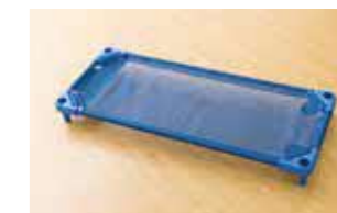
コット(簡易ベッド) 1歳以上児のお昼寝で使用するコットは拭いたり洗ったりできるので、常に清潔な状態を保てます。

感染症対策のため、手洗い、うがいを徹底し、各保育室の入口には消毒液を設置。「衛生管理マニュアル」に基づく衛生管理の下で保育を行います。スタッフは園内外の研修で感染症予防の知識を深め、実践しています。