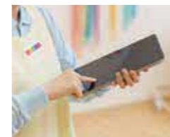
タブレットを活用しスマート管理

子どもの記録、指導案や保護者との連絡にICTを導入。手書きの書類を減らし、事務作業を効率化。保育士が保育に携わる時間を増やすとともに保育の情報共有もスムーズに行えます。