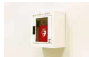
AEDを完備 子どもの命を守るため、各保育園にAEDを完備しています。スタッフは操作ができるよう普通救命講習を受講します。

全スタッフが普通救命講習を受講。「危機管理マニュアル」に沿った保育を行っています。あらゆる場面を想定し、防犯、防災訓練を実施。また、日々のヒヤリハット事例の共有により、安全への意識を高めています。