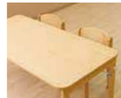
角の丸い安全な家具

子どもたちの主体的な活動を尊重して、おもいきり遊べる環境に配慮しています。日頃の事故予防や不審者の侵入防止策、災害時の備えなど、子どもたちの安全を守るために施設の設備を整えています。