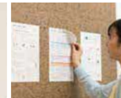
画紙を使わない掲示板