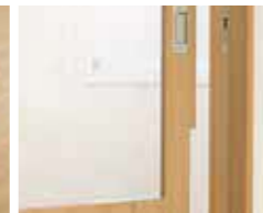
指をはさまないドア・引き戸