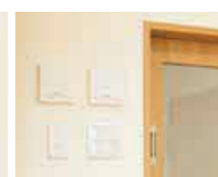
コンセントは手の届かない位置に