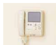
訪問者を確認できるインターフォン