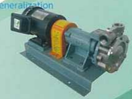
CB型 Direct-coupling cascade pump