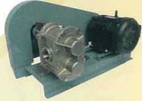
Vベルト駆動型ギヤポンプ V-belt-driven gear pump