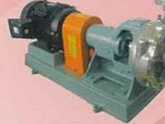
FX型 Centrifugal pump