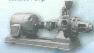
1.25インチ 2段カスケードポンプ 2-stage 1.25-in. Cascade Pump