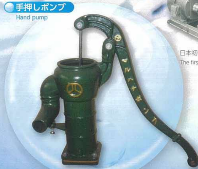
鉄道省の時代に全国の駅で利用された手押しポンプ A hand pump used at stations all across Japan back in the days of the Ministry of Railways