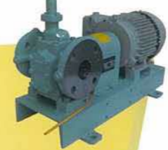
カップリング直結型 ギヤポンプ (NHG型) Direct-coupling gear pump