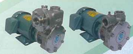
カスケードモーターポンプ Cascade motor pump