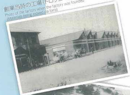
創業当時の工場(トロッコで資材運搬) Photo of the factory when the factory was founded (Materials being moved via trolley)

Since 1923, we have been providing specialty pumps for any and every type of liquid imaginable as "pump specialists MALHATY PUMP". First starting with hand pumps, we then added a variety of other kinds of pumps to our lineup over the years, including cascade pumps, piston pumps, and various types of centrifugal pumps, all thanks to the faithful support and patronage of our customers. We plan to continue working on new technologies and products in order to meet the growing needs of our customers as we branch out into new fields expected to see further growth in the coming years, such as solar power generation, batteries, and biotechnology.