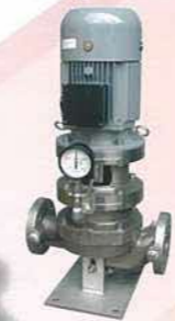
ステンレス製ラインポンプ Stainless steel line pump