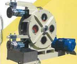
チューブポンプ Tube pump