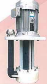
スラリー液に対応したポリプロピレン製渦巻ポンプ Polypropylene centrifugal pump designed for use with slurry