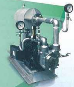
マイクロバブル発生装置 Micro-bubble generator