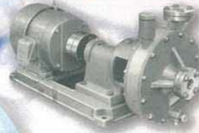
日本初の塩ビ製渦巻ポンプ The first vinyl centrifugal pump in Japan