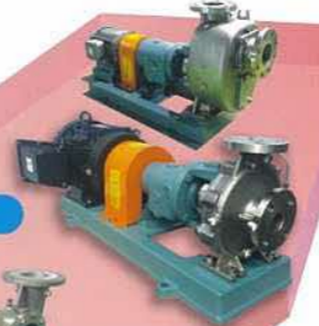
MAP型渦巻ポンプ MAP centrifugal pump